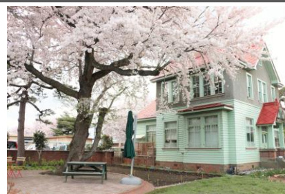
写真：弘大カフェ（旧制弘前高校外国人宣教師館）と桜